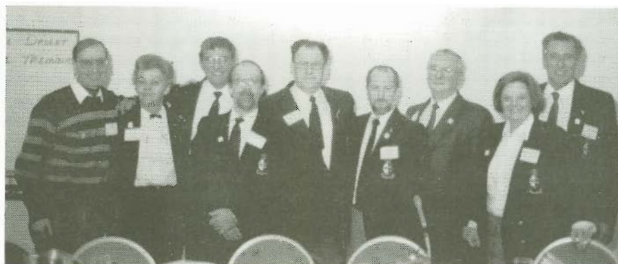
Sur cette photo, vous apercevez le nouvel exécutif. De gauche à droite: